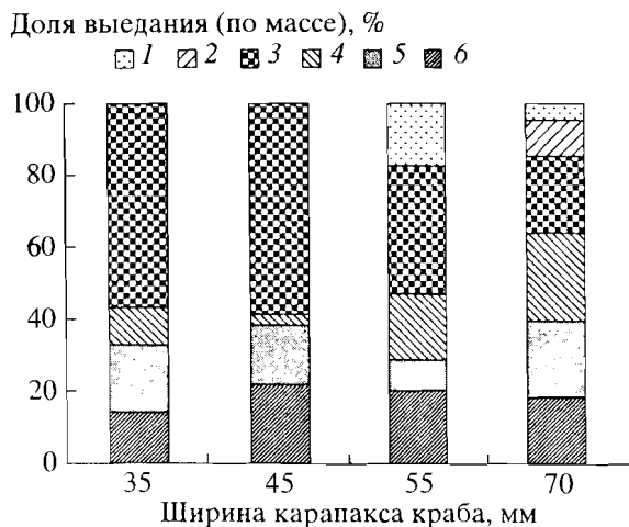
Рис. 2. Выедание неполовозрелыми крабами разного возраста различных групп зообентоса в эксперименте. 1 – Asteroidea, 2 – Echinoidea, 3 – Ophiuroidea, 4 – Gastropoda, 5 – Bivalvia, 6 – Polychaeta.

использовать консументы следующего порядка и деструкторы. По-видимому, в местах массового скопления и питания крабов плотоядные беспозвоночные получают дополнительное преимущество, выраженное в увеличении пищевых ресурсов, что должно привести к увеличению их численности.